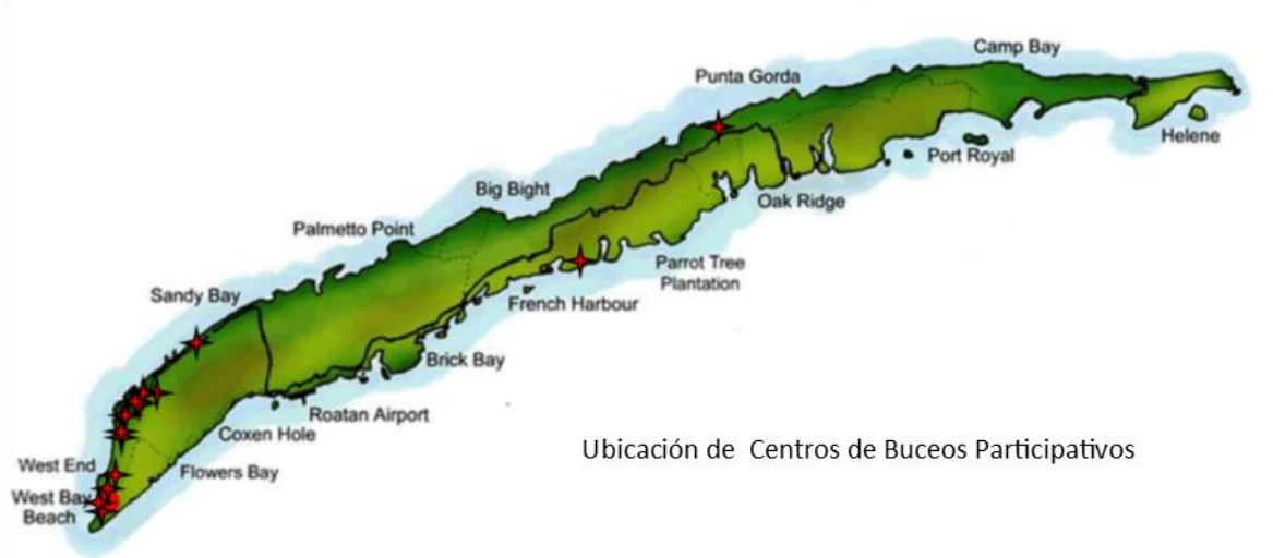
Ubicación de Centros de Buceos Participativos